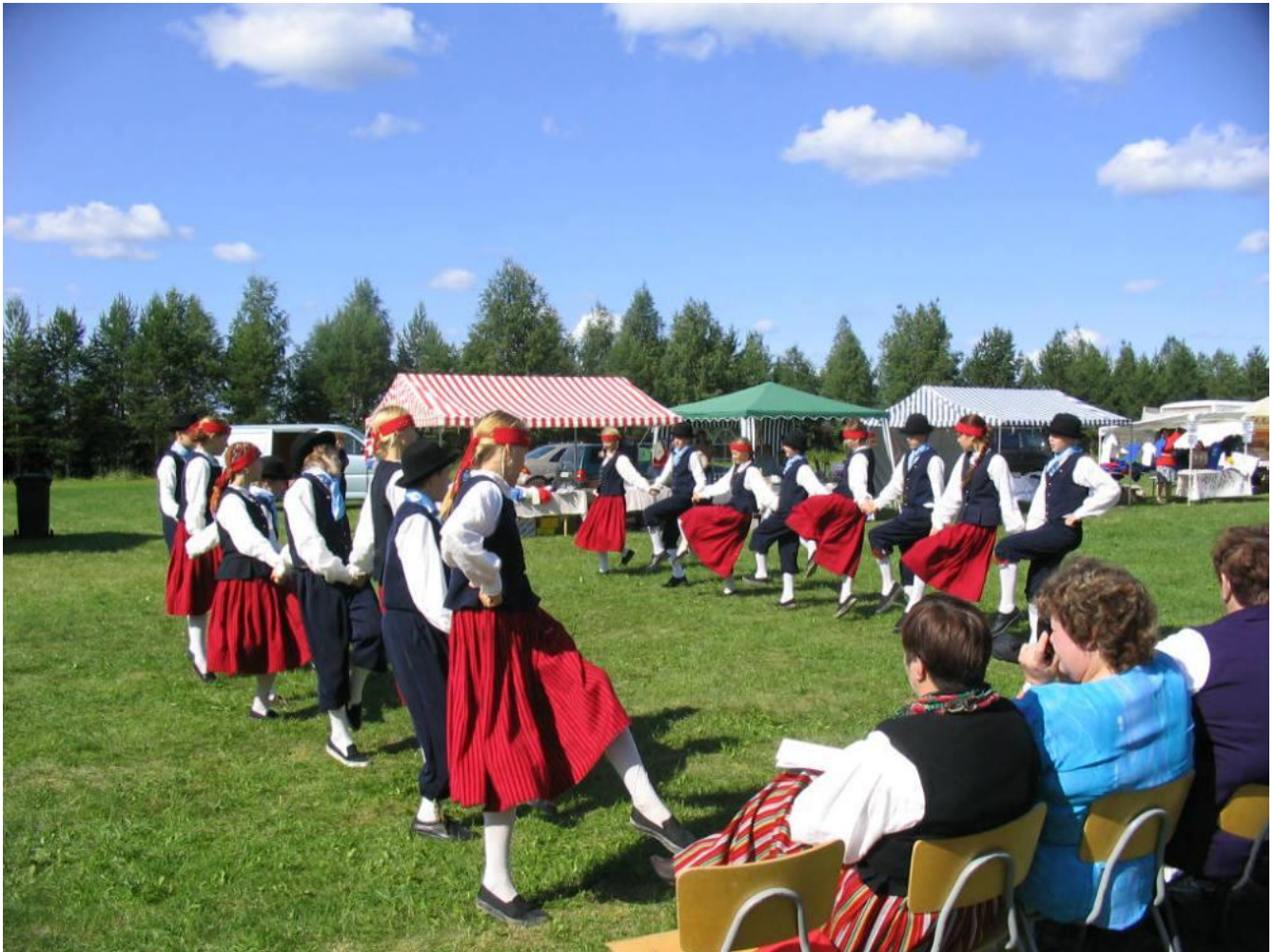
Lohijärvi 2004, vieraita Virosta